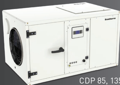
CDP 85, 135, 175